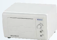
ОПЦИОНАЛЕН МИКРО ПРИНТЕР

ВТЕ-23D приема тристепенно предварително вакуумиране.